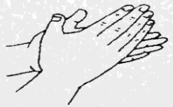
图 A.1 掌心相对揉搓