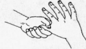
图 A.5 拇指在掌中揉搓