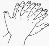
图 A.2 手指交叉, 掌心对手背揉搓